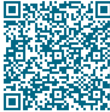
Pflege von Angehörigen