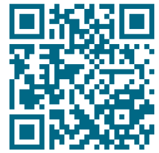
Personaldezernat (nur Intranet)