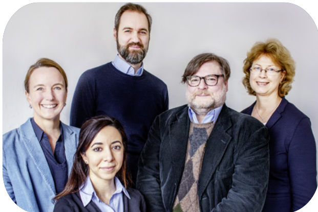
Ihr Team des EZSE

Ihre Teilnahme an TRANSLATE-NAMSE kann dazu beitragen, dass nicht nur Sie, sondern auch zukünftige Patienten eine schnellere Diagnosestellung und bestmögliche Behandlung erfahren.